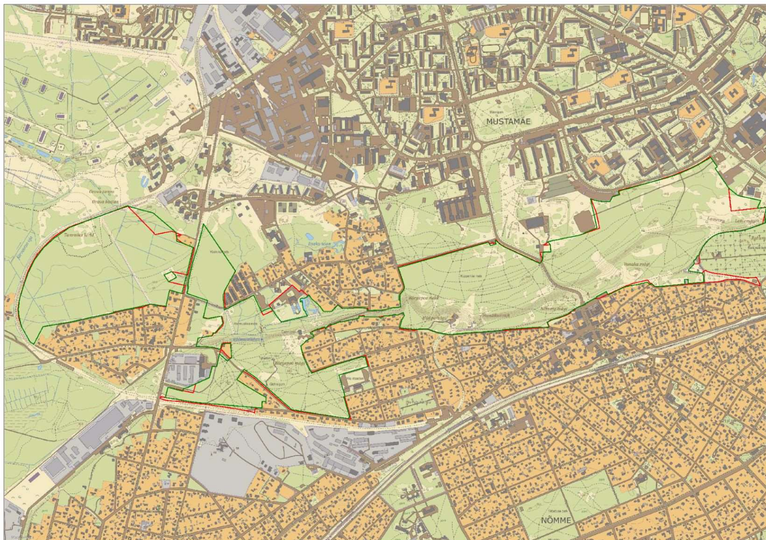
Lisa 1. Nõmme-Mustamäe MKA välispiir (punasega kehtiv piir, rohelisega planeeritav piir)